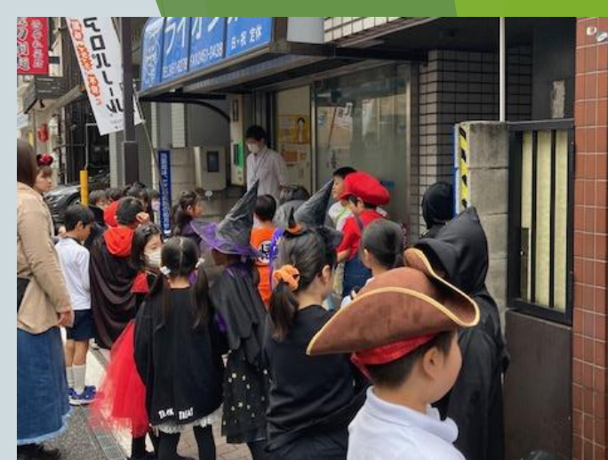
ハロウィンパレード(2年生)