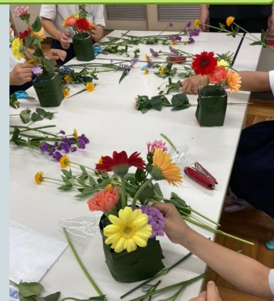
花育 (フラワーアレンジメントを通して)