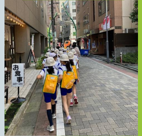
2年生 まちたんけん