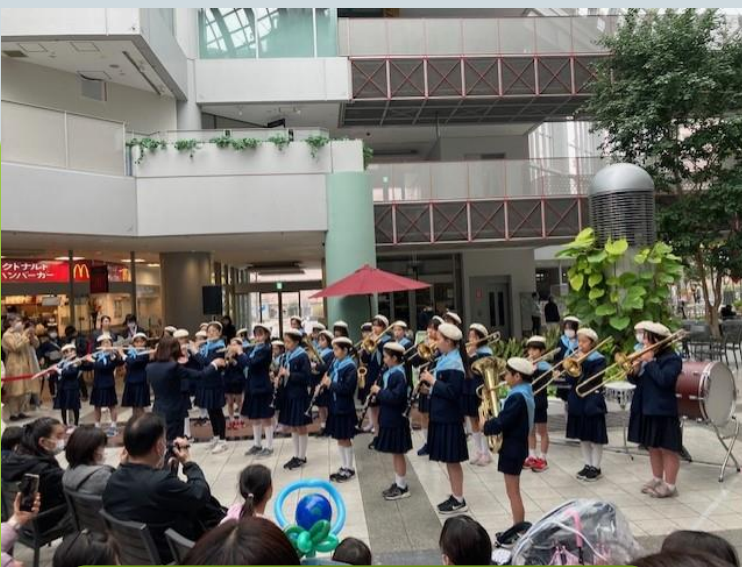
シンフォニックブラス