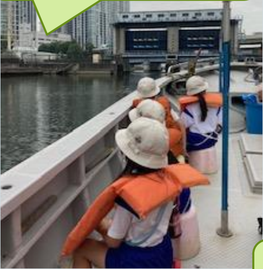
3年生 芝沖クルーズ