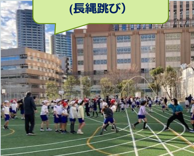
チャレンジジャンプ (長縄跳び)