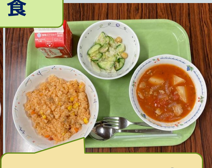
国際メニュー(アフリカ)