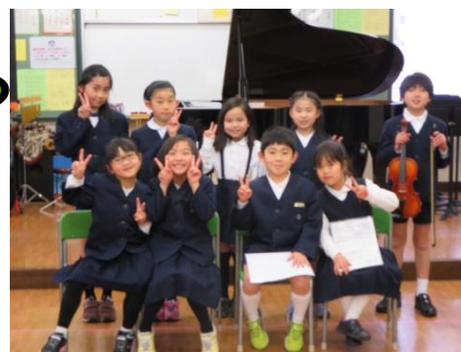
昨年度3月16日の写真です。